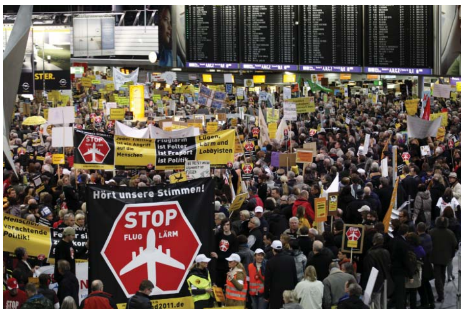
Tausende protestieren jeden Montag am Frankfurter Flughafen gegen den Fluglärm.